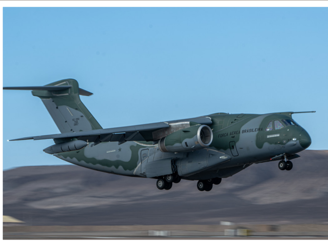
Izquierda, abajo: La FAB empleó uno de sus KC-390 para soporte logístico.

(1981 a 1983), de los cuales el primero llegó a la nación sudamericana en febrero de 2010. El 982, ex 57-2594 y el avión operativo más antiguo de Chile, regresó recientemente del mantenimiento en los Estados Unidos que duró casi un año completo. Según los informes, el 982 voló directamente desde su entrega en Estados Unidos a un entrenamiento para la "Parada Militar" escoltado por dos Vipers en septiembre pasado. Actualmente se desconoce cuáles son los planes de la FACH con los otros dos Starotankers que están estacionados desde hace varios años en Pudahuel, cerca de Santiago. Actualmente se rumorea dentro de fuentes de la FACH que la Fuerza Aérea de los Estados Unidos está dispuesta a vender a Chile algunas de las variantes "R" que dejará de lado con la llegada de su problemático Boeing KC-46A Pegasus.