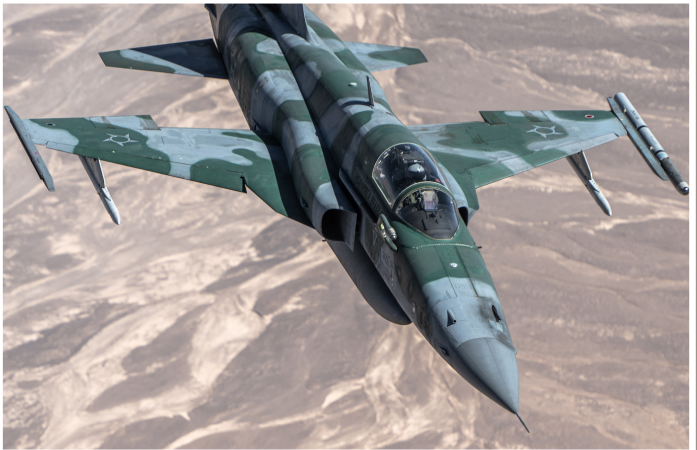
Arriba: F-5EM de la Força Aérea Brasileira.