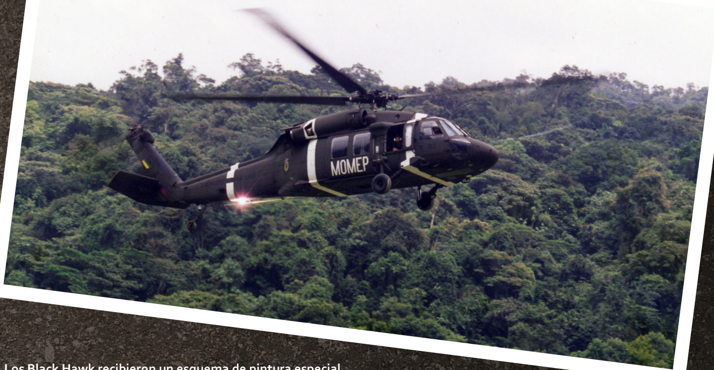
Los Black Hawk recibieron un esquema de pintura especial para que sean fácilmente identificables.