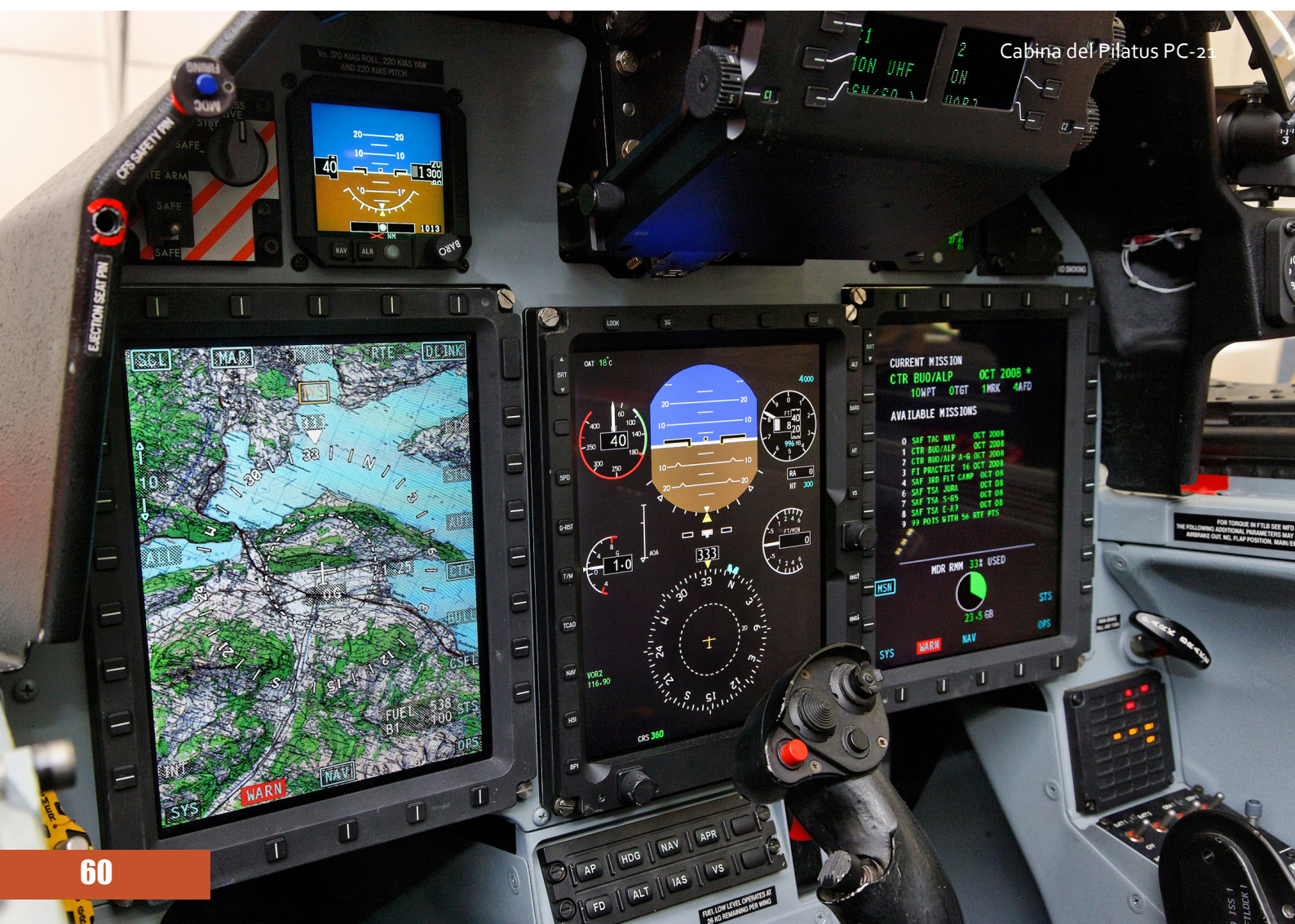
Cabina del Pilatus PC-21

Corea del Sur comenzó en 1988 el desarrollo de un entrenador avanzado para su fuerza aérea, dentro del programa KTX (Korea Trainer Experimental), por parte de Daewoo Heavy Industries (que en 1999 pasó a ser KAI – Korea Aerospace