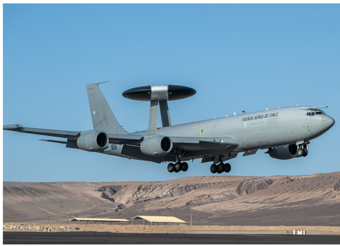
Izquierda, centro: El Salitre fue el primer ejercicio en el que estuvieron presentes los E-3D Sentry de la FACH.