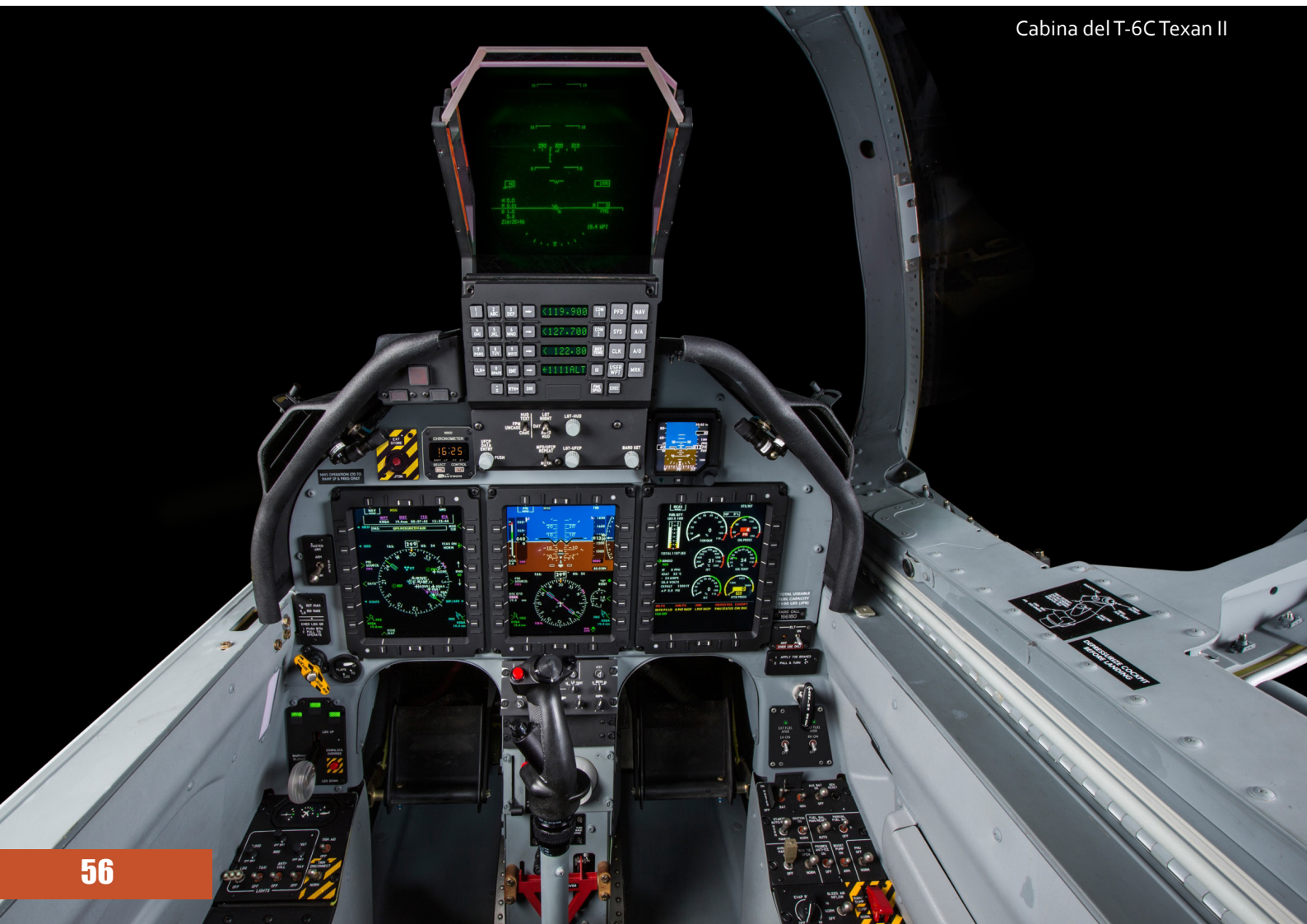
Cabina del T-6C Texan II

El Desktop Avionics Trainer es una computadora con pantalla táctil, con la aviónica T-6B/C alojada en ella, que muestra los tres MFD y el panel de control frontal, lo que permite al estudiante tocar los mismos botones y recibir el mismo resultado que en la aeronave, mientras que el Egress Procedures Trainer replica la cabina delantera, el asiento eyectable y la cúpula, incluyendo la sujeción del piloto, oxígeno y conexiones del traje G para la práctica de procedimientos de entrada, salida y salida